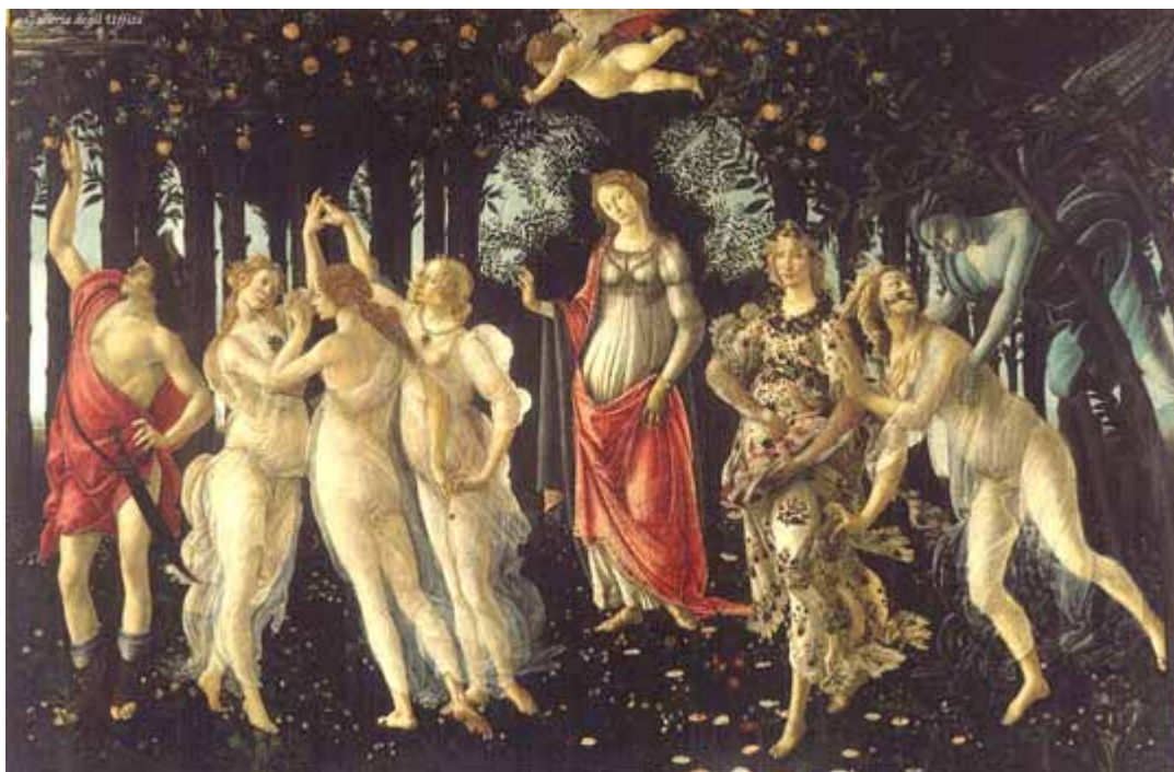
Sandro Botticelli, Primavera (Wiosna) , 1477-78, 203x314 cm, Galeria degli Uffizi, Florencja