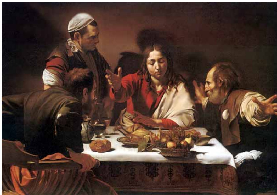
Caravaggio (Michelangelo Merisi), Wieczera w Emaus , 1601-02, 140x197 cm, National Gallery, Londyn