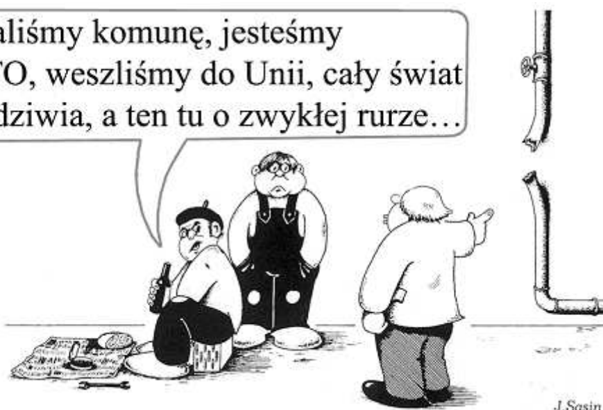
Jacek Sasin, Do Unii i z powrotem .